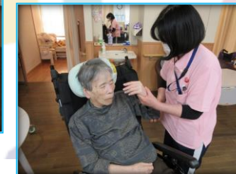
顔や肩、口腔内の マッサージをしています