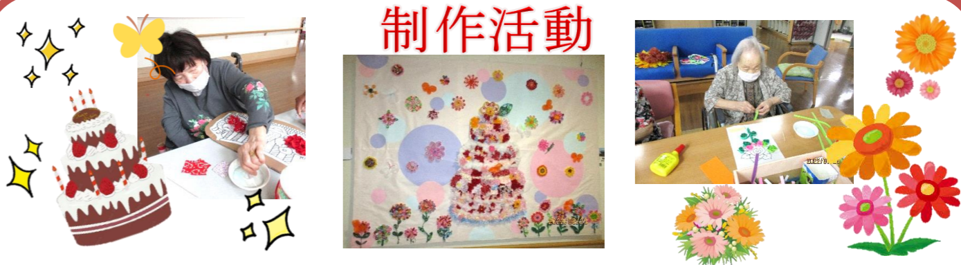
色画用紙を、切って丸めてカラフルな花とケーキが完成しました。

利用者様間での、現金や物のやりとりは当苑では固くお断りさせていただいております。再度、ご理解の程よろしくお願い致します。