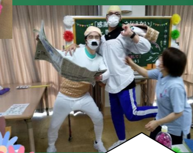
感謝の気持ちは…皆さん、ご利用ありがとう！