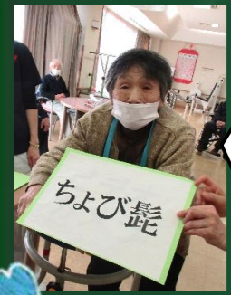
ちよび髭、引いたわ。