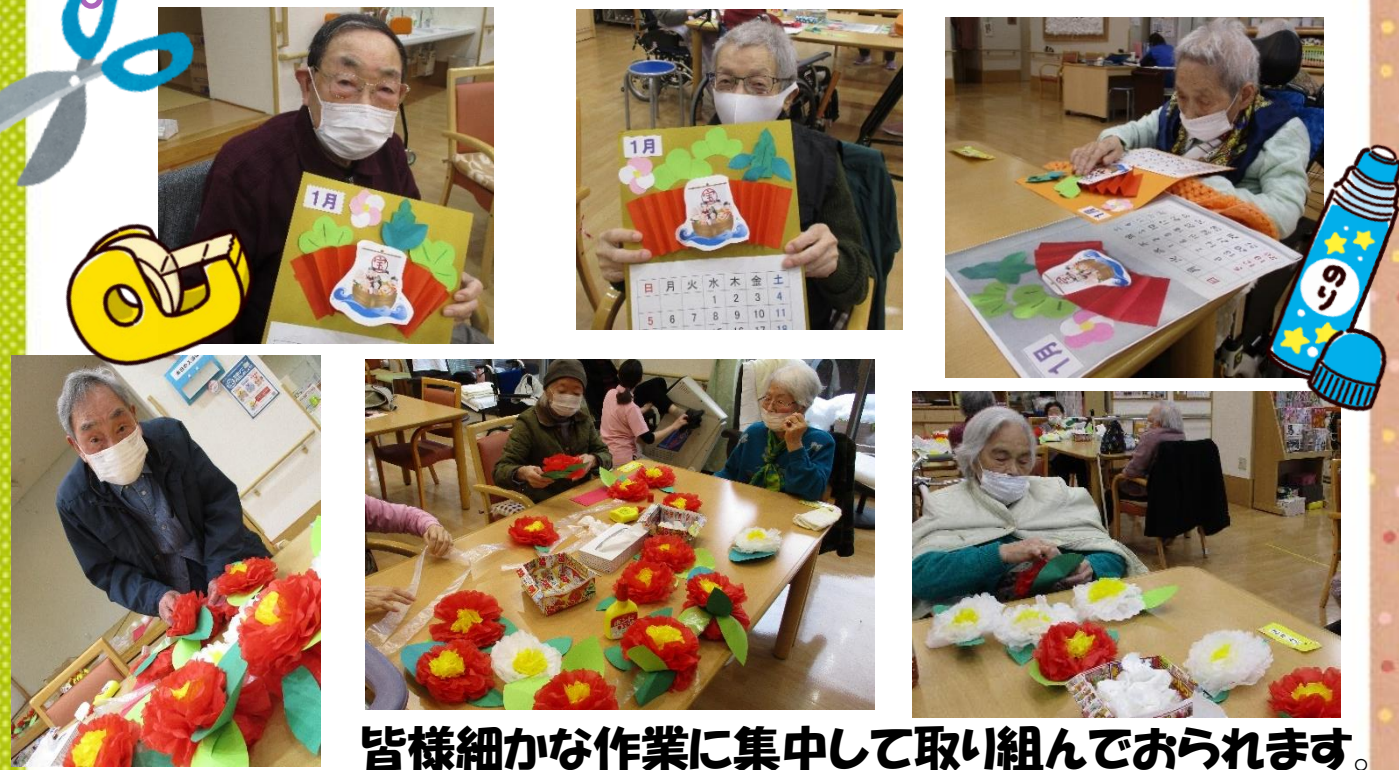
皆様細かな作業に集中して取り組んでおられます。