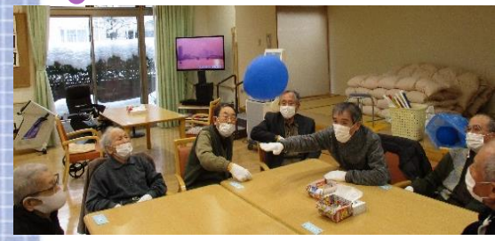
風船バレーに挑戦しました。 風船を落とさないようにみんなでトスをつながぎます！