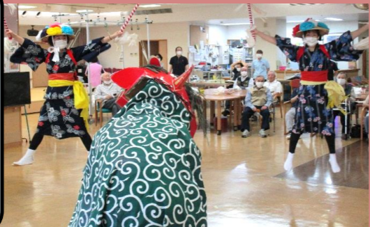
鳳鳴苑獅子方若連中