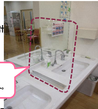
洗面所の中にアクリル板導入。