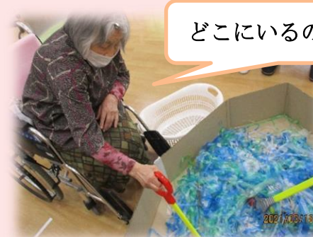
どこにいるのかしら?