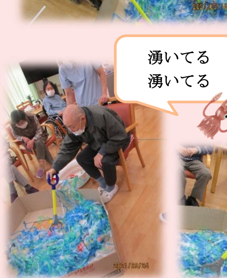
湧いてる 湧いてる