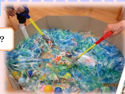
イカだけねらって 掬ってね!!