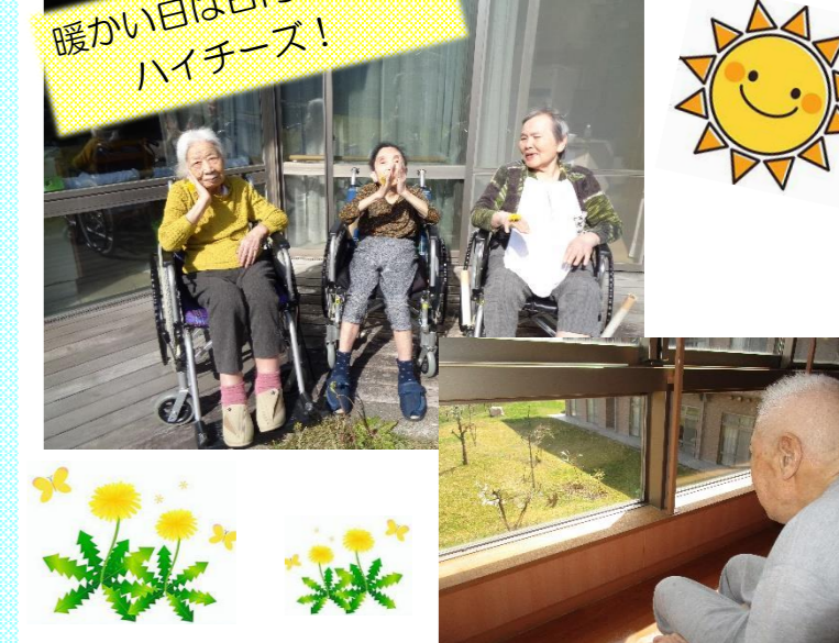
4/22 お部屋やベランダから ブルーインパレスの飛行を見学しました。