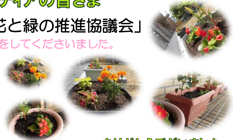
(敬称略) ありがとうございました