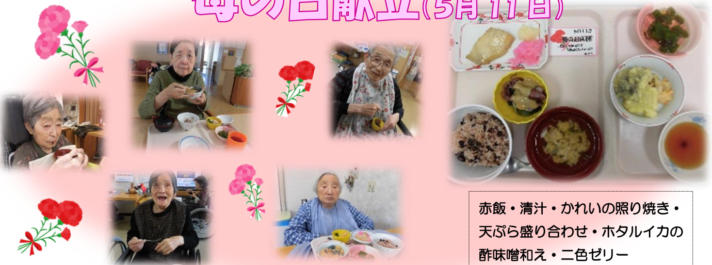
赤飯・清汁・かれいの照り焼き・ 天ぷら盛り合わせ・ホタルイカの 酢味噌和え・二色ゼリー