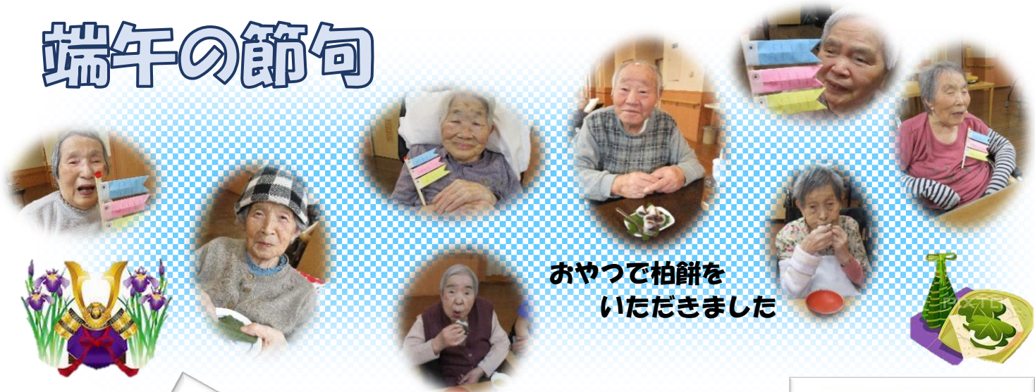
おやつで柏餅を いただきました