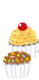
なんちゅ 美味しそうなが~