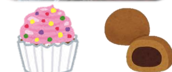
どれにしようかな?