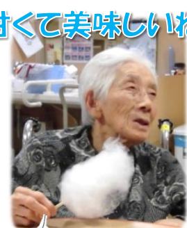
甘くて美味しいね♪