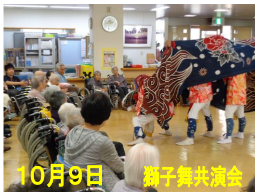
10月9日 獅子舞共演会

平成28年11月号 特別養護老人ホーム ユニット型特別養護老人ホーム 鳳鳴苑 http://www.fukuhoukai.jp/