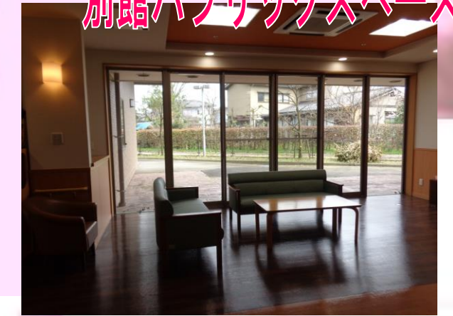
別館パブリックスペース