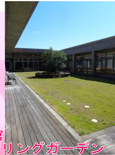
新館 ヒーリングガーデン

近年の少子高齢化に伴い、介護を必要とする方が今後も増えるものと予想されています。人の心の痛みがわかる暖かい雰囲気のもとで、入居者様・ご家族様・地域の皆様と共に「敬老愛護」の精神で介護サービスに努めてまいりたいと思っております。